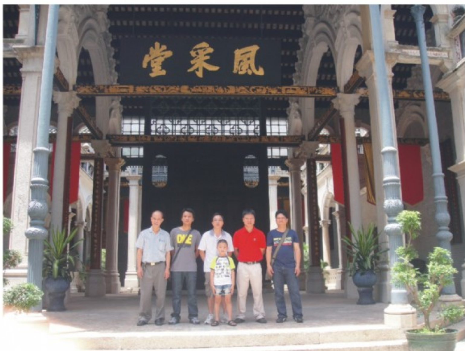
风采堂QQ群宗亲造访风采堂