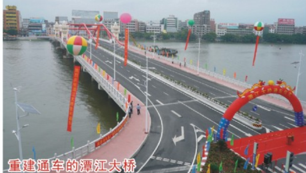
重建通车的潭江大桥

6车道，共15跨，主跨为60米，通航孔净高不小于5米，净宽46米，施工招标中标造价约为5564万元。