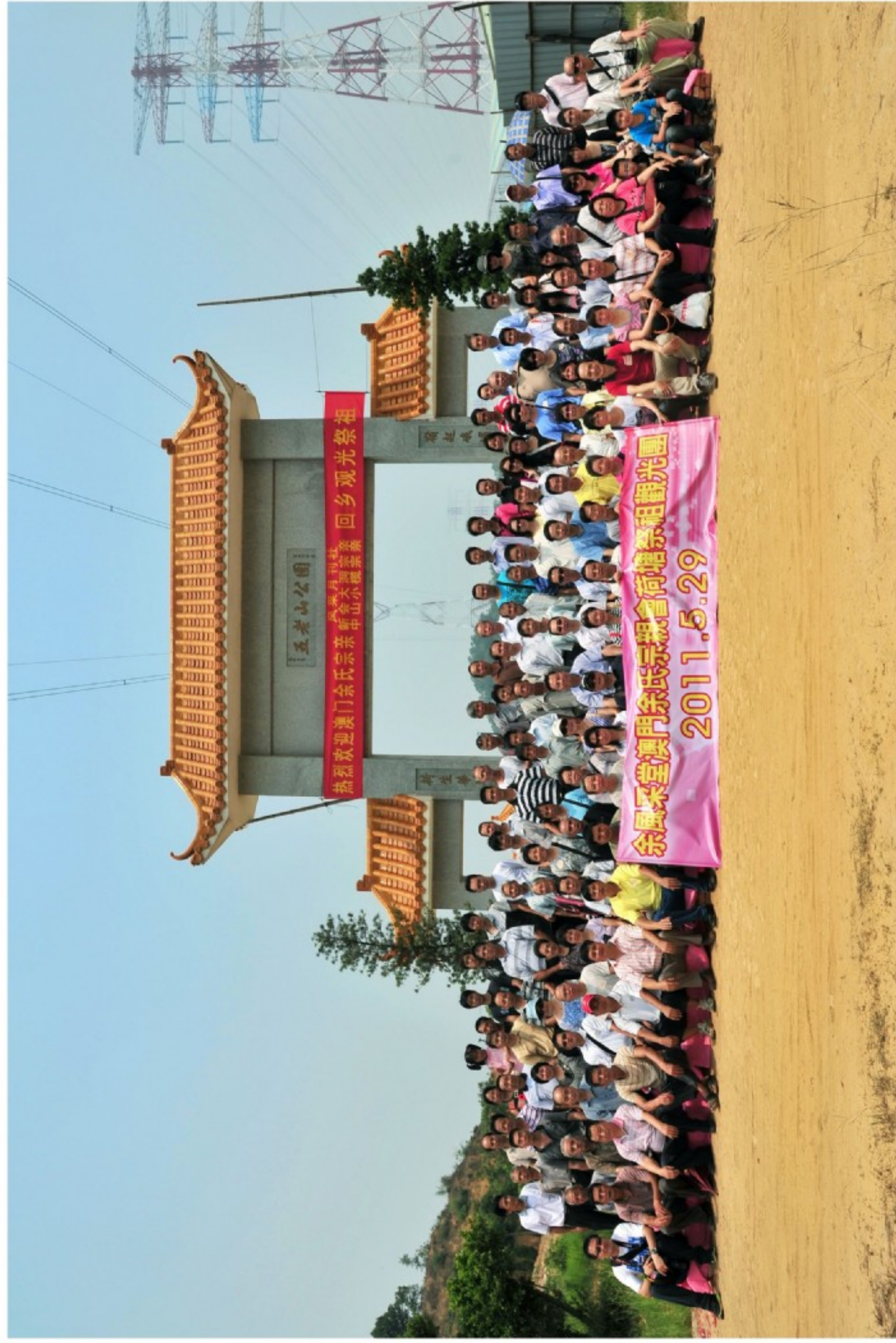
澳門余氏宗親會在荷塘祭祖合影