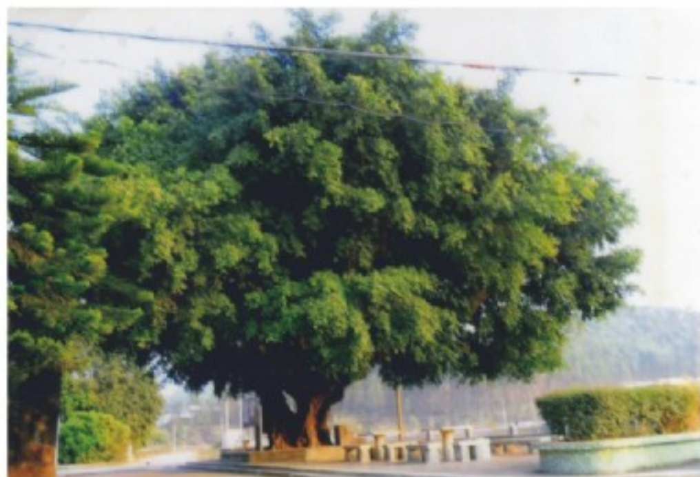
槐湖村百多年的古榕壮观

随着村民生活水平的不断提高，村民的生活观念和要求也不断在提升。大家都晓得谈谈人生享受，一日三餐吃些什么营养？吃什么会延年益寿？吃什么就滋补养颜？什么能壮筋活络。年轻的男女更关注衣着，虽则没有绝对讲究春夏秋冬四季不同，但冷暖厚薄、质量好差也是不容疏忽的。大家都讲究大方得体 and 清洁明