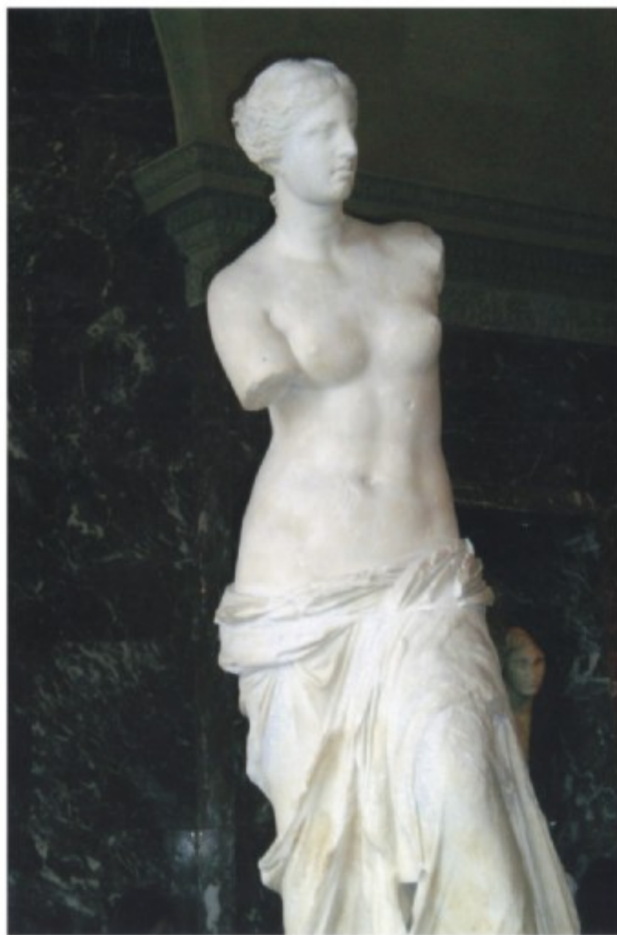
法国巴黎卢浮宫美神维纳斯汉白玉雕像

而远离巴黎市中心西南 22 公里外的凡尔赛宫，是当了 72 年法国国王路易十四建造于十七世纪。随后，路易十五、路易十六也把这里当作宫廷。一百多年来，三代国王留下了无数五彩缤纷的人体绘画、人体雕塑、精巧工艺品和生活用品，其奢侈豪华令人叹为观止。天花顶上绚丽的绘画艺术，似乎只是愉悦观的“奇技淫